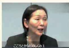
こころからのしくみ 1