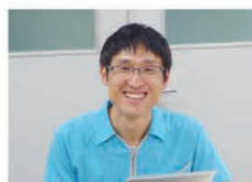
医療法人 喬成会 介護老人保健施設 オアシス21

当院では入院患者さんの高齢化に伴い、臨床現場での介護の力が重要となってきました。そのため多くの介護福祉士が仲間となり力を出してもらっています。介護福祉士が医療の現場で協働してケアを提供することのなかで、介護福祉士への教育が大きな課題でした。今回、学研メディカルサポートに「学研介護サポート」配信が開始されたため、即導入を決定しました。学習意欲のある介護福祉士にとって「非常に有意義である」との感想をもらっています。