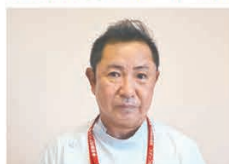
長野県厚生農業協同組合連合会 北アルプス医療センター あづみ病院

介護職員の研修する機会をつくり、知識・技術の習得、向上を目的として「学研介護サポート」を導入し2年となります。月ごとに受講テーマを決め、業務後に各自で受講しています。また、決められた受講テーマ以外の研修ができる環境も設けています。今では介護職歴の少ない職員、経験を積んでいる職員、どちらにも共通した知識の習得・復習ができる大切な時間になっています。この研修を導入したことで、自らの研修意欲の向上や、一人だけではなく、介護職員全体の共通の知識・技術の向上につながっています。職員からも「あの研修、よかった」などの声も聞かれます。これからも、専門職としての介護を究める方法としてこの研修を継続し、それが「利用者の笑顔」にもつなげていけると、信じています。