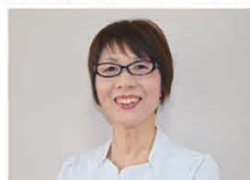
医療法人 弘遠会 すずかけヘルスケアホスピタル

まず、月初めにオンデマンド研修として全フロアに日程とタイトルを掲示し、月4回程度、勤務就業後に集合研修として会議室で実施しています。研修内容は研修委員が決定し、また当施設の年間研修に合わせて4月・5月は新人教育を目的とした内容、11月は感染症を意識した内容を取り入れ、その時に必要な研修に的を絞り、職員のスキルアップにつなげています。スタッフは熱心にメモを取りテストを受け、わからないことがあれば質問し、配布資料のコピーを求められることもあります。去年は全12回の研修をすべて受講したスタッフには、継続して学習に取り組んだ努力を称え、表彰を行いました。今後も「学研介護サポート」を受講することにより、施設全体のスキルアップにつなげていきたいと考えています。