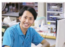
特定医療法人社団 清和会 介護老人保健施設 清和苑