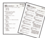
テスト・解答解説