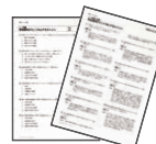
テスト・解答解説