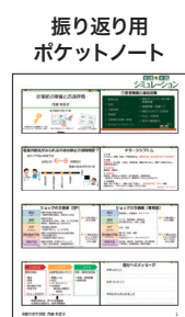
振り返り用 ポケットノート

導入から振り返りまでいねいな 解説があり、個人学習に最適です。 ワークシートは集合研修でも ご活用いただけます！