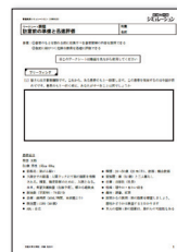
集合研修用 ワークシート